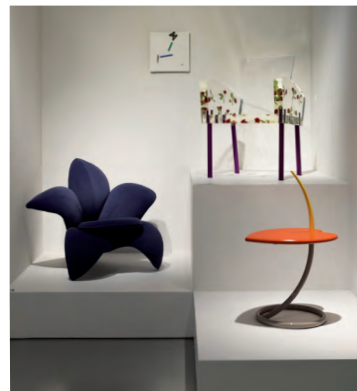
「形流意動：M+ 設計藏品」展覽現場：日本後現代主義家具；圖片由香港 M+ 博物館提供