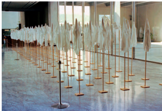
臺北市立美術館 1986 年的「日本現代織物造型展」展覽現場