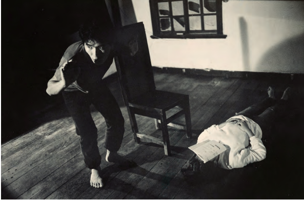
河左岸劇團在淡水團址老屋進行排練；黎煥雄提供，吳忠維攝影