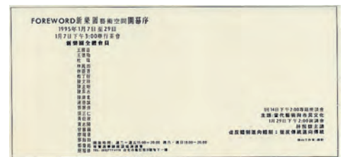
左圖—— 1995年「牽手紀念日」展覽 DM © 姚瑞中