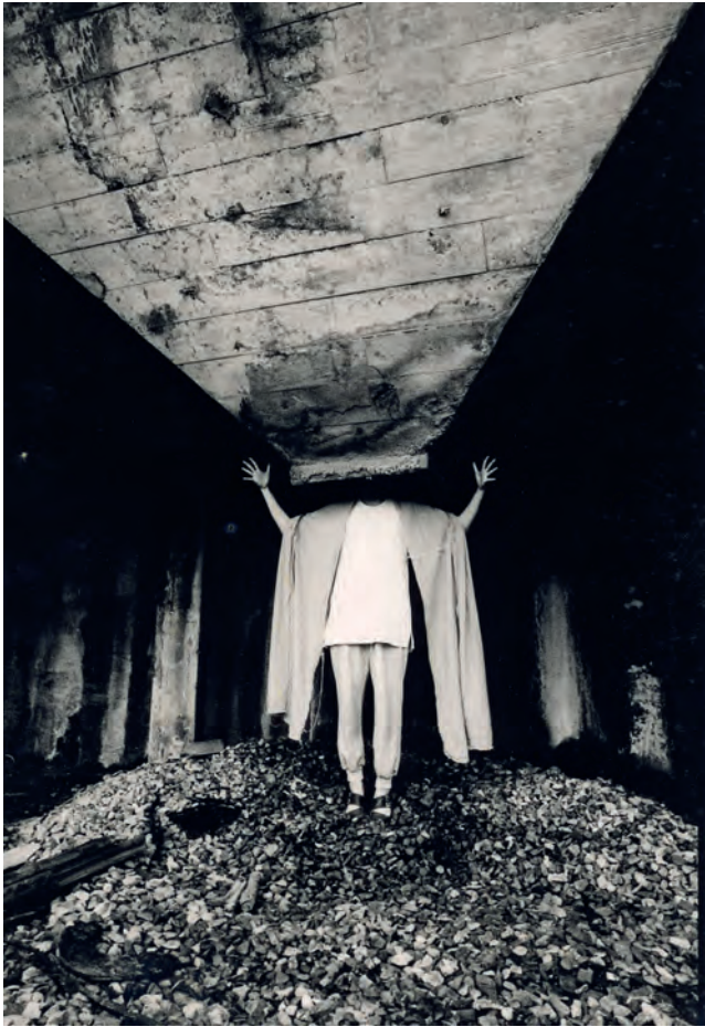
左圖—— 「天打那實驗體」1994年國家 劇院實驗劇場《哈姆雷特機器》 表演紀錄