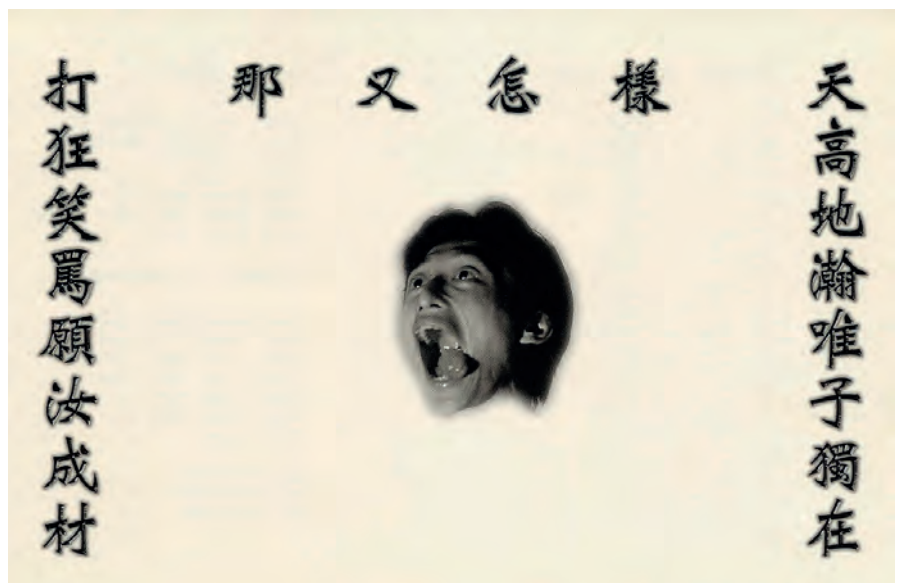
「天打那實驗體」打油詩

不曉得與星象週期有沒有關係，「二十年」約莫是回望當年社會發展並論功過的「熟成」時間。即便物是人非，但未到蓋棺論定的時刻，「二十年」時差下的論述不僅可能摻合當事者殊異的觀點爭辯，更加入了後輩論者的歷史評判。立足於時代性與社會尺度的後見之明，其豐富性甚至可能溢出史實本身。所謂「史實」在二十年的時差下，容易像極了變形蟲：無首無尾、樣貌瞬異、韌性極強。撇去星象論，因時間推移而轉換論述對象、論者論述權越大的這個現象，其因素大抵與論者個人（及其所屬的社群與世代）資歷／資本積累有直接關係，其餘變因取決於該事件、物件本身相對客觀、可計量的價值——無論是市場價值、學術價值，或訴諸集體記憶的所謂「歷史價值」。