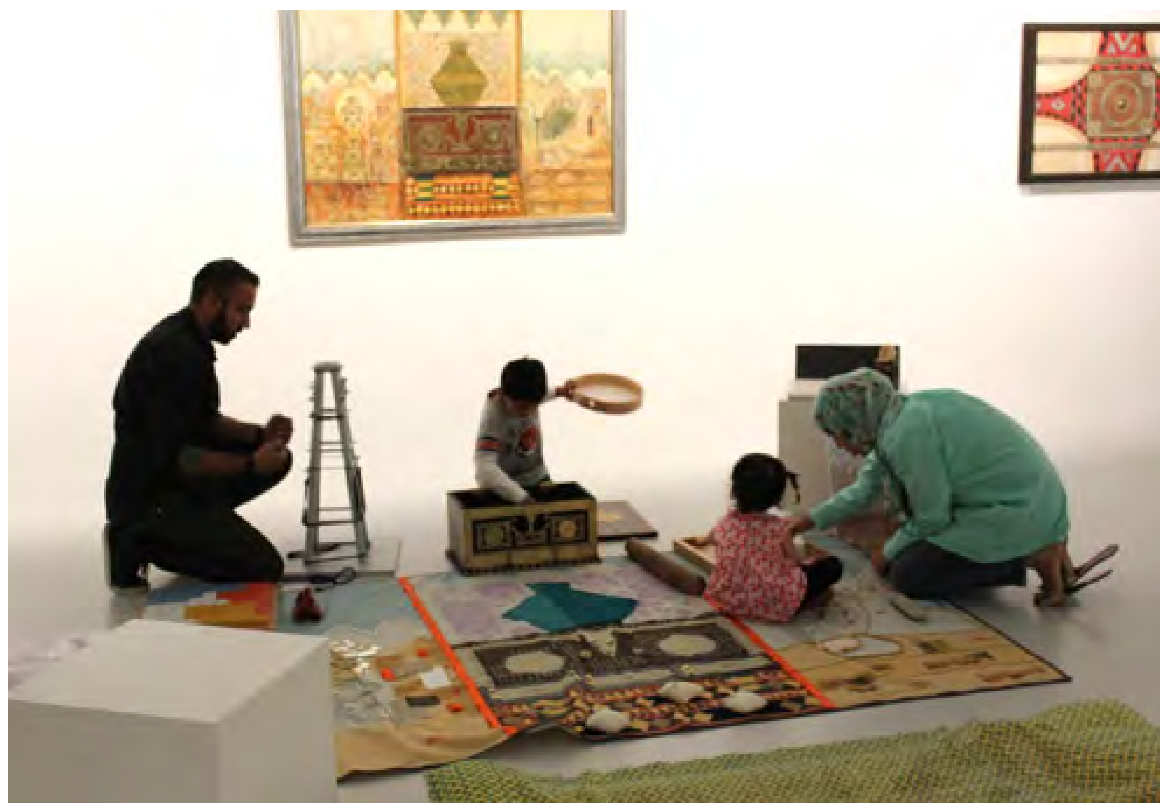
參與五感探索的家庭