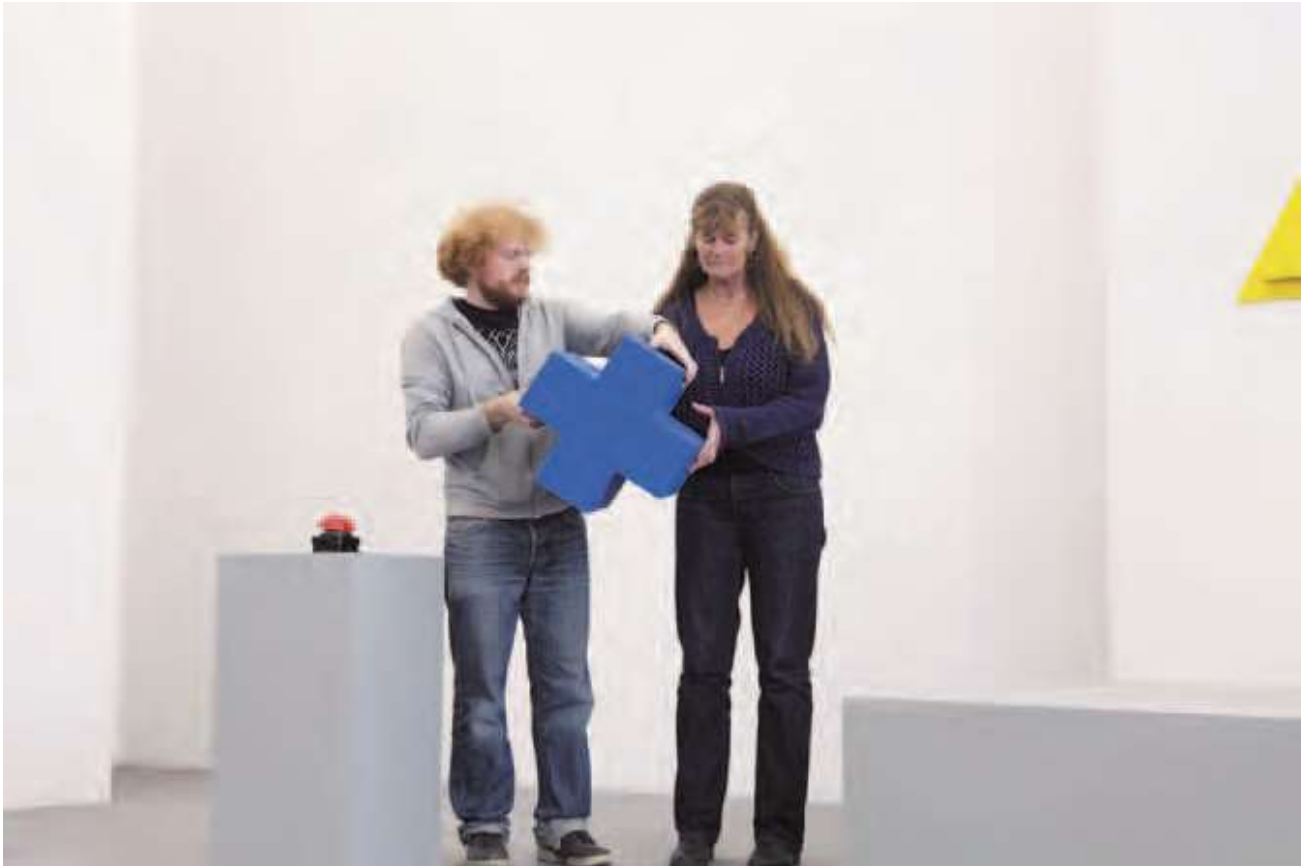
▲ 藝術家一邊解說選項，一邊將這三個立體積木一一交給母親，母親便一步步地上樓把每個積木嵌入形狀相符的槽內。