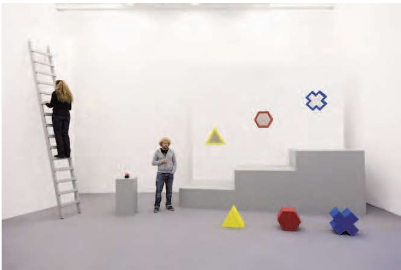
▲ 貝克爾思的行為創作幾乎都以說故事為開場白。左方為藝術家母親在梯子上等待著。

著。故事由孩提時的經驗慢慢談到如今自己害怕面對的事實——遲早母親會離他而去。藝術家將面對恐懼的解決方案化為三項選擇題；一、面對並解決，二、改變現狀，讓恐懼不再發生，三、直接逃避（如同他母親一般）。每一選項由一個幾何積木作為代表，分別為三角型、六角型和十字型，而這三個立體積木可直接嵌入位於三層樓梯上方的鏤空槽，象徵此方案的可行性。藝術家一邊解說選項，一邊將這三個立體積木一一交給母親，母親便一步步地上樓把每個積木嵌入形狀相符的槽內。