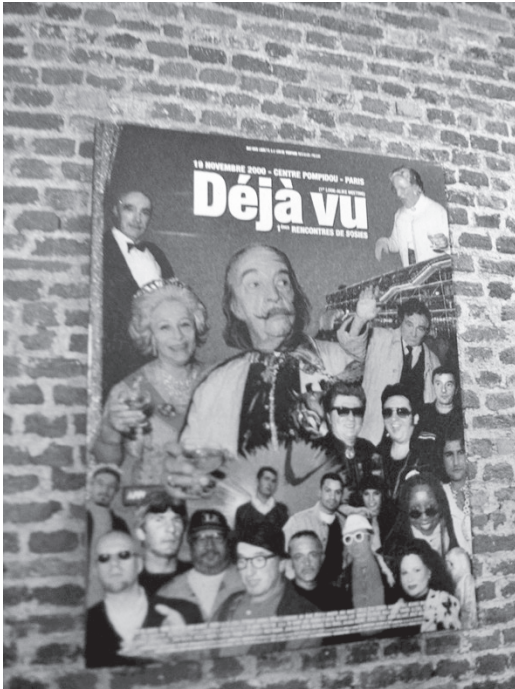
圖4 馬修·羅罕特，〈似曾相識：第一次國際相貌酷似者聚會〉(Déjà Vu: 1st International Look-alike Convention)·2000。海報(原型)/deValence 設計，巴黎·2001；lambda 打印、鋁製鑲版·160 × 120 厘米；2000年10月19日聚會場景，巴黎龐畢度中心「觀展之外」(Au delà du Spectacle) 展 (Let's Entertain)

參與〈似曾相識〉者的影像隨性地構成一組「相貌酷似者」團隊的照片集。名人的分身和真人的本尊齊聚一堂，最終人們無法分辨誰是誰。冒牌的明星甚至搶走了真人的風采，引來一連串「撲朔迷離」的效應而造成轟動。技術藝術 (Technikart) 雜誌編輯因此將羅罕特選為「本月風雲人物」。〈似曾相識〉系列展演所留下的照片、錄影或海報，看起來似乎塑造了好萊塢壯觀的景象，事實上是讓觀者思索「分身或本尊」身分識別的辯證關係 (Barachon, 2005)。布歇 (2005) 認為，此名人盛會系列相當有抱負，因為它具有文化產業影像傳播的效益。